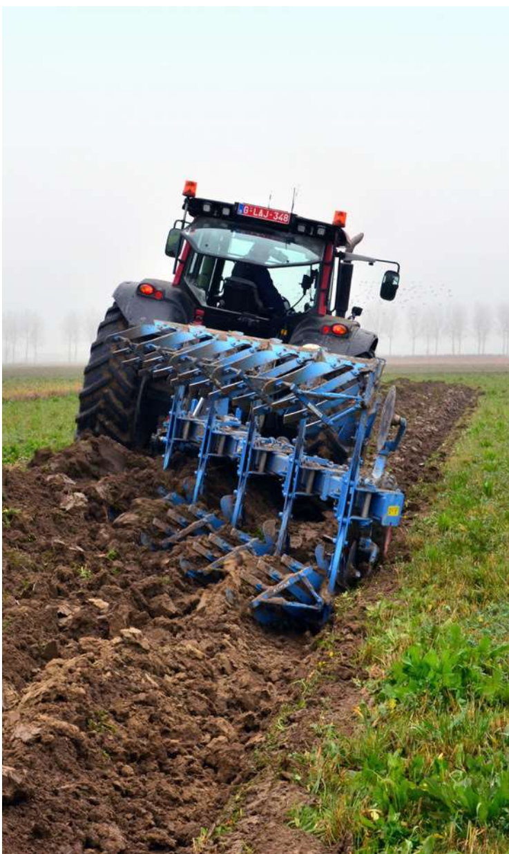
Aanleg keverbank Jochem Sloothaak