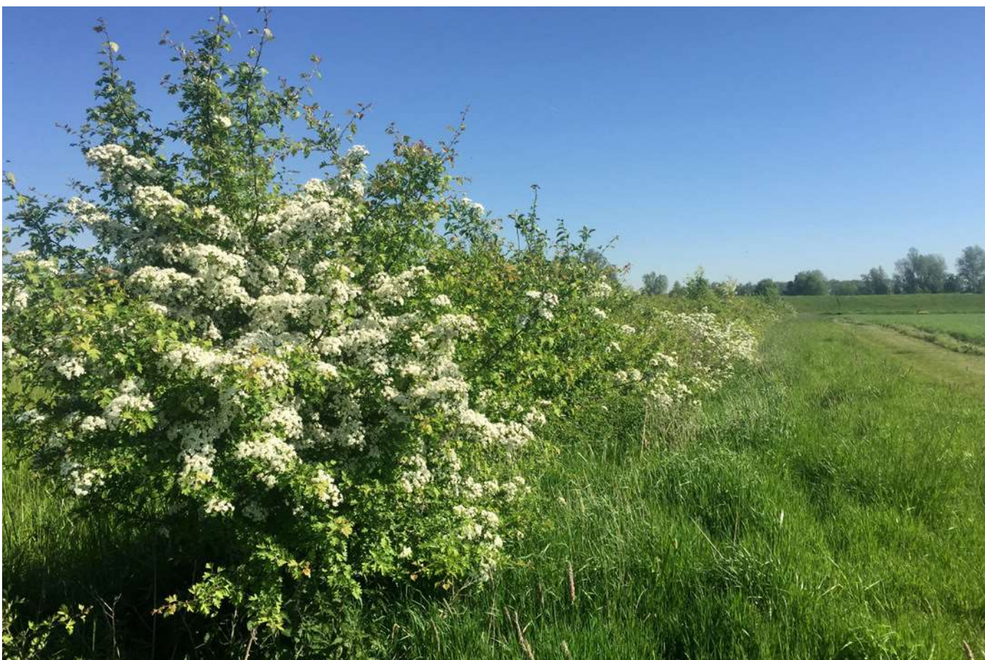
Patrijzenhaag, Jochem Sloothaak