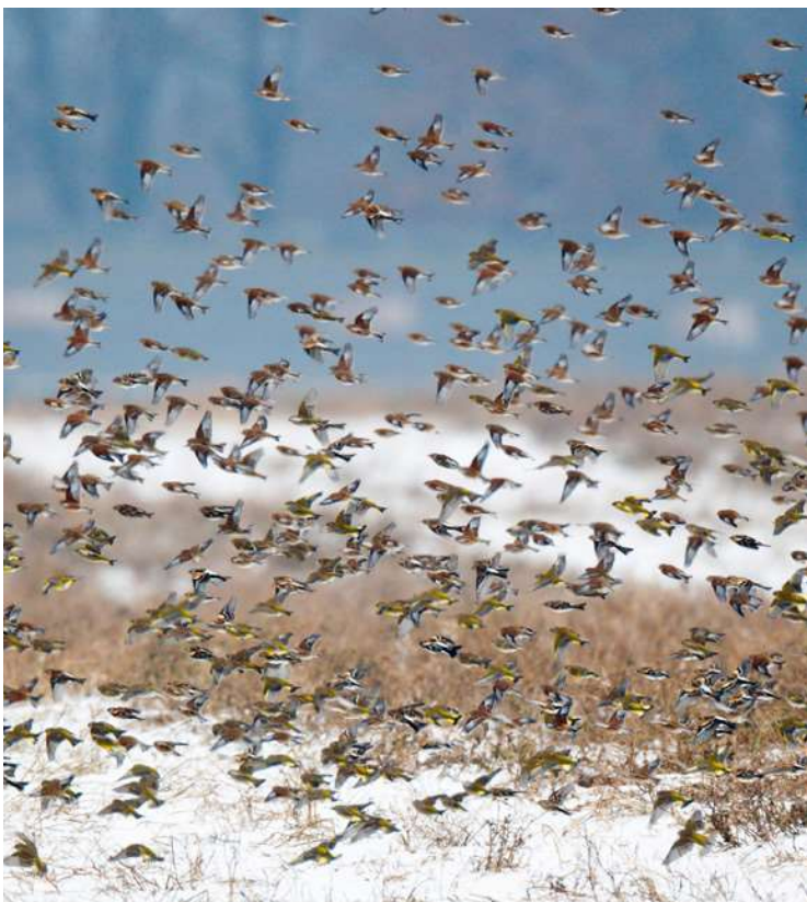
Overwinterende kneuen

Percelen met winterstoppels kunnen jaarlijks rouleren. Eventueel kunnen de stoppels ook nog tot en met de volgende zomer blijven staan. Zo'n stoppelveld met spontane (onkruid)vegetatie is vaak erg aantrekkelijk voor broedende akkervogels. Laat het stoppelveld dan tot minstens 1 augustus onaangeroerd. In de nazomer kan dan een groenbemester worden geteeld.