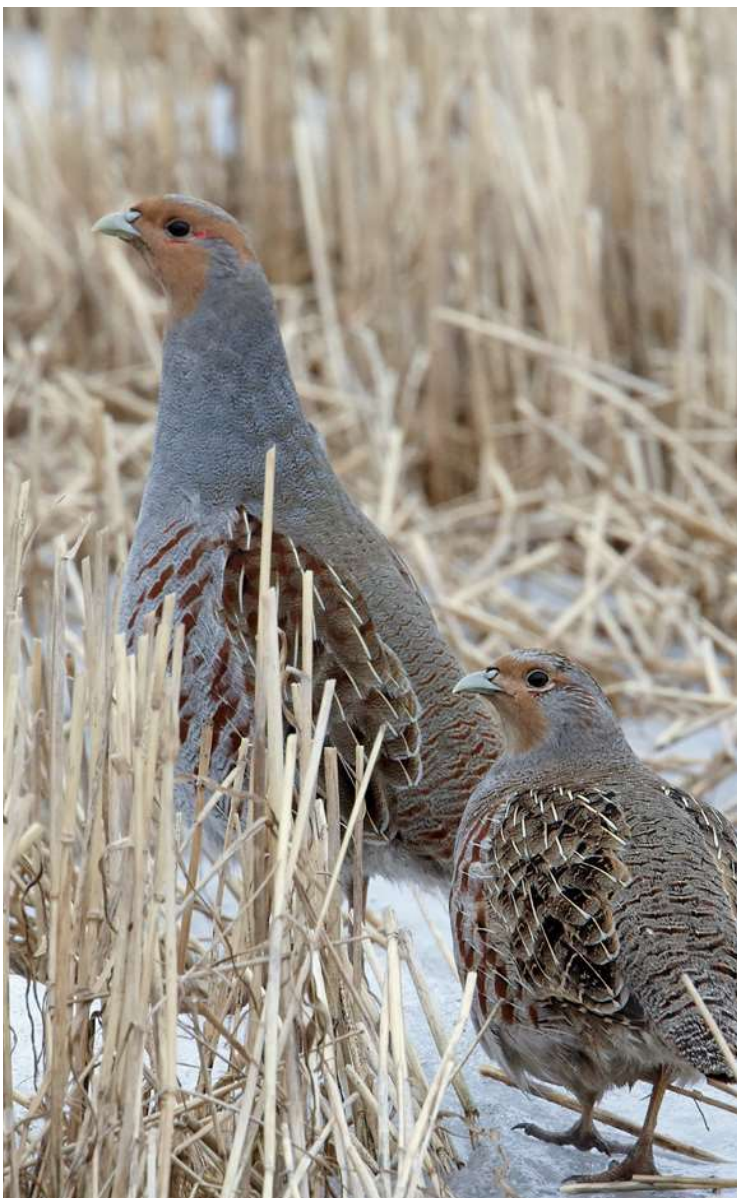
Patrijzen in de sneeuw